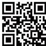
QR Code zur App

Die WayGuard-App gibt Ihnen das Gefühl nicht alleine zu sein. Sie begleitet Sie auf Ihrem Smartphone. Wenn Sie sich auf den Heimweg machen, starten Sie die App. Nun können das Team WayGuard und von Ihnen (im Vorfeld) ausgewählte Kontakte Ihren Heimweg auf der Karte verfolgen und wissen so immer wo Sie sind. Im Notfall können Sie über den Notruf-Knopf Hilfe rufen. Wenn Sie angekommen sind, informieren Sie mit einem Klick. Die App wurde gemeinsam mit der Polizei NRW entwickelt.